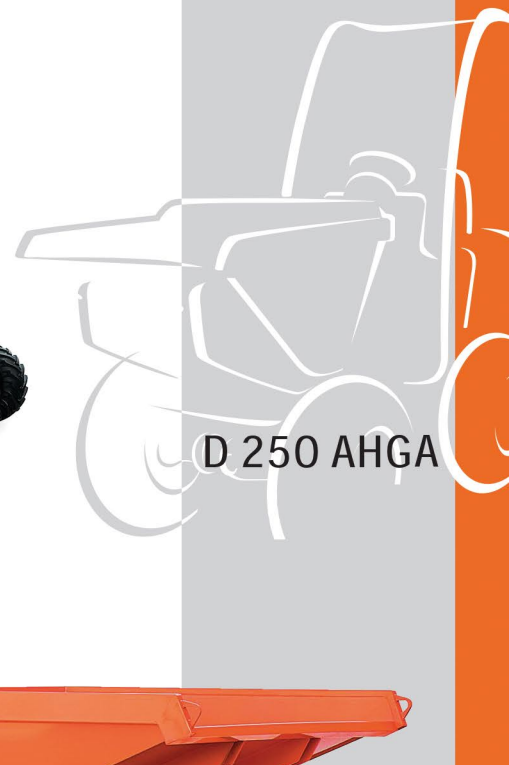
D 250 AHGA